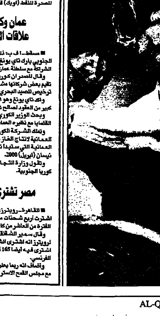
هكذا من العمل

ويضيء ذلك عدم الاتصاف لنداعات تقنية في أوبك لاتخاذ اجراءات أكثر تشددا للحد من المخزون والضغط وحل مشكلة ركود الطلب العالمي فيما يبدو بؤسها بخلاف جديد حول مدى التزام أعضاء أوبك بقراراتهم التي تم اتخاذها في اجتماعهم الأخير في فيينا غدا الأربعاء دون أن يبدو مستويا لها في 20 عاما.